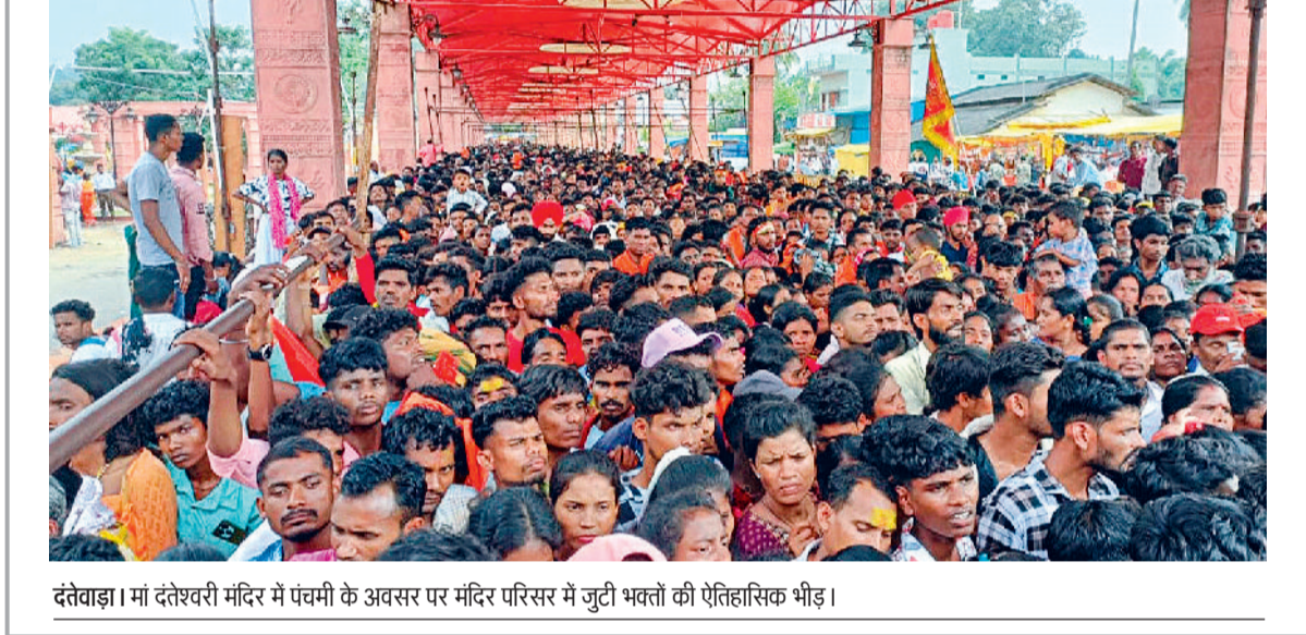
दत्तेवाड़ा। मां दत्तेश्वरी मंदिर में पंचमी के अवसर पर मंदिर परिसर में जुटी भक्तों की ऐतिहासिक भीड़।